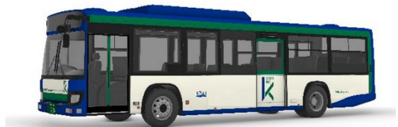
京成バス千葉イースト