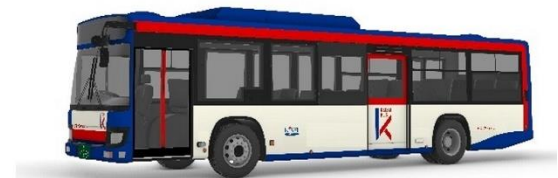
京成バス千葉ウエスト