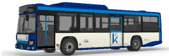
京成バス千葉セントラル